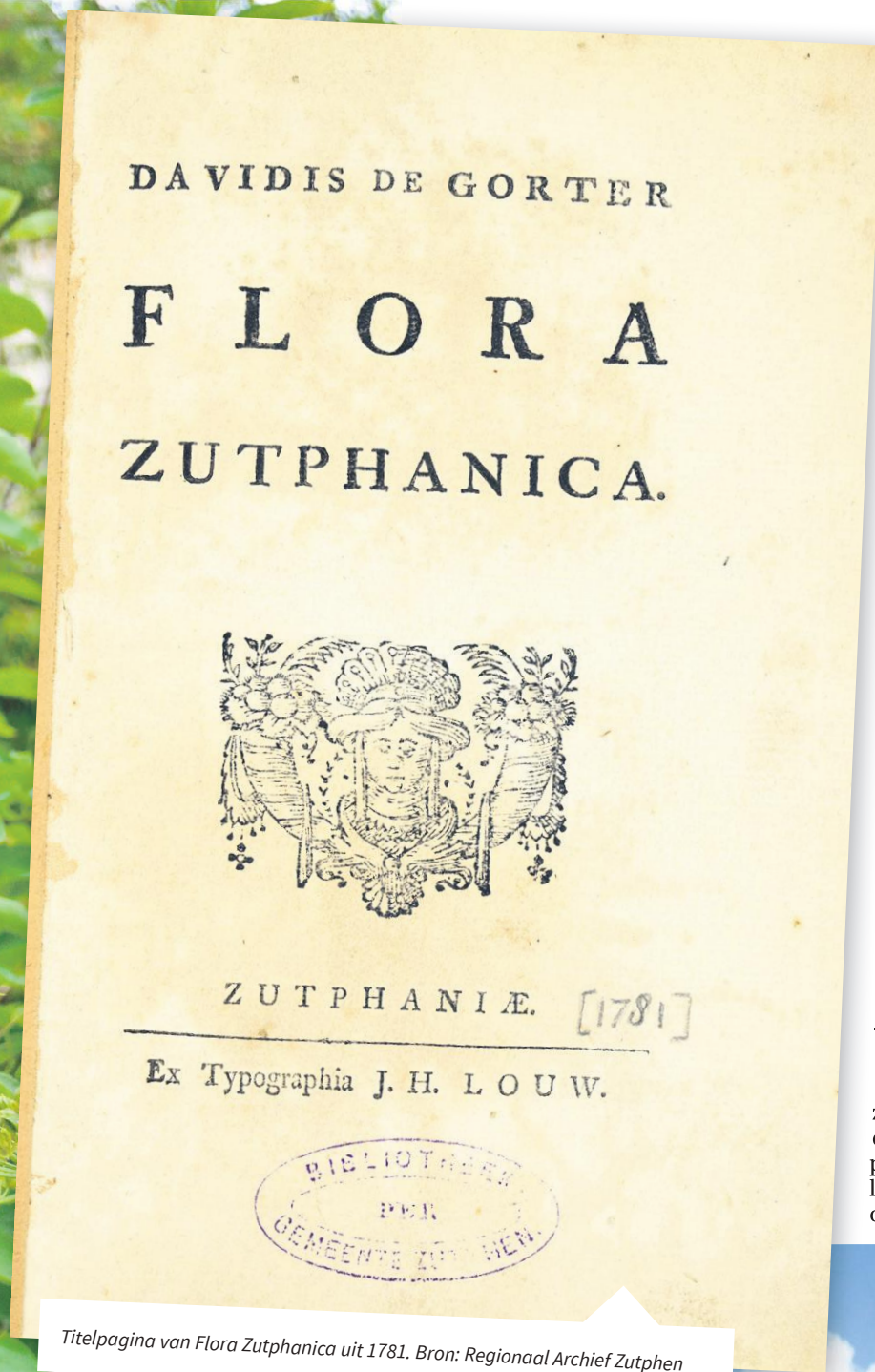
Titelpagina van Flora Zutphanica uit 1781.